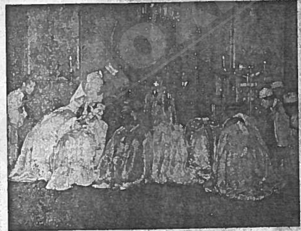
ጋትርያርኩ እሱተ ማሕ ልላይ ላላት እስተርካፍላ ።

ታስቦ ጣሪያውን ግድግዳውን ረርሶ እንደገና በመታገድ ላይ ነበርና በዚህ የገንጋት ልላልተቻል በዚያው አጠገብ በምትገኝ በመሐረም ይይ ቅድስት ግርያም ዜተ ክርስቲያን ጥር 2/ ግድ ሰጥ ወት ቅዳሴ እደረገ ። ቅዳሴውን ለመስገትና ለራዚያቸውን ለመቀበል የተሰበሰበው ሕዝብ በጣም ብዙ ነበር ። እንደ አጋጣኝም ልጎችን እንደተቆየውን መነሱት ከየገዳማቱ ተሰብስበው በዚያ ስለተገኙ ቅዳሴው በግንጋ ደምቶ ተሰምቷል ።