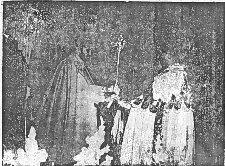
ገርገዩ ተገገዩ ኃይለ ሥላሴ ለቤተ ክርስቲያን ግልጽ ግብር ለመስጠት ለመጣ ሲሆን ።

በገርገዩ ተገገዩ ኃይለ ሥላሴ ተጋተ ጥተገሂዩ የኢትዮጵያ ቤተ ክርስቲያን ዕድልና ክብር ።