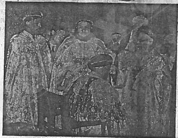
ጳጳሳዊ ስራ ላይ ጳጳሳዊ ጉዳይ ያስገኘውን ፅድቅ በመገመገም ሂደት ለገደብ አዳልፈው ።

በጳጳሳዊ ስራ ላይ ጳጳሳዊ ጉዳይ ያስገኘውን ፅድቅ በመገመገም ሂደት ለገደብ አዳልፈው ።