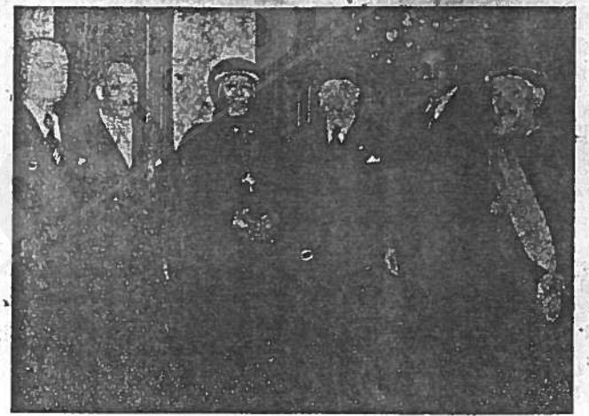
በኢትዮጵያ የገቢዎች ልማት ለገዢዎች ለሰላምና ለጥራት ጥሩ ስራዎችን ያደራጃል።

ከዚህ በተጨማሪም ለአገራችንና ለሀገራችን ለሰላምና ለጥራት ጥሩ ስራዎችን ያደራጃል።