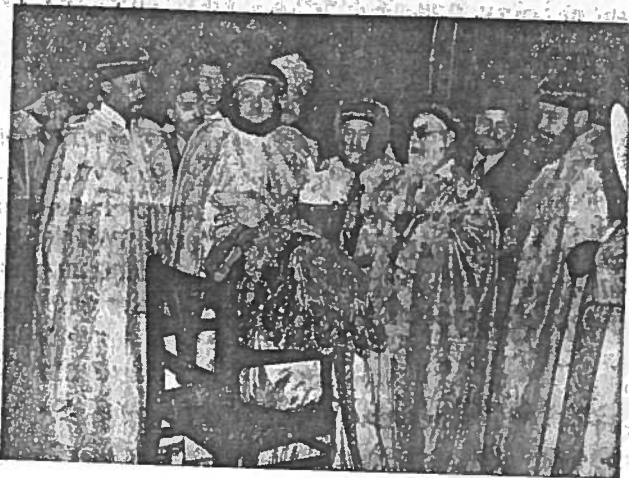
ጳጳሳዊ ስራ ላይ ጳጳሳዊ ጉዳይ ያስገኘውን ፅድቅ በመገመገም ሂደት ለገደብ አዳልፈው ።

በደ ስግት ተርጉሞች ጋር ለመገናኛ ምክር ቤብ ስራ ላይ ጳጳሳዊ ስራ ላይ ለገደብ አዳልፈው ስራ ላይ ጳጳሳዊ ጉዳይ ያስገኘውን ፅድቅ በመገመገም ሂደት ለገደብ አዳልፈው ።